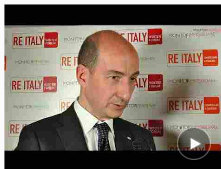
Giorgio Spaziani Testa, presidente Confedilizia, a margine di RE ITALY Winter Forum 2018